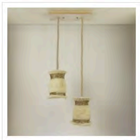
Oslo - Suspensions