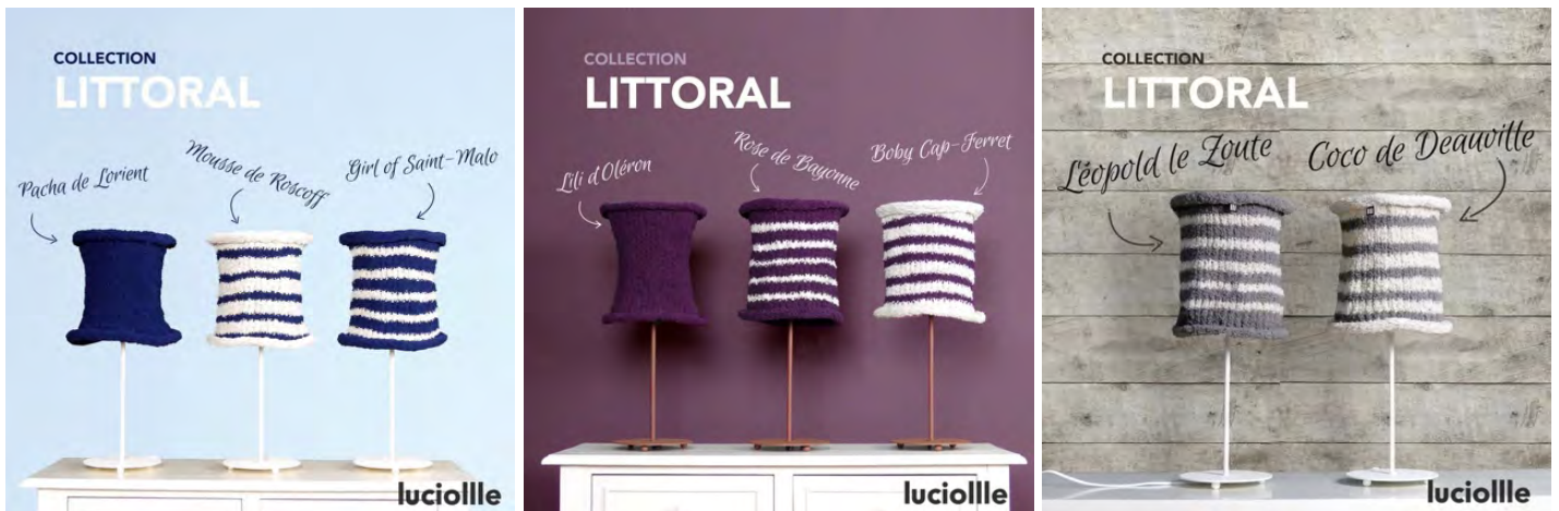
La collection Littoral propose typiquement des abat-jours qui sentent bon les vacances en bord de mer en toutes saisons... ou d'ailleurs.

Les 3 collections actuelles de la gamme Les Audacieux sont Terra Incognita, Littoral et Little.