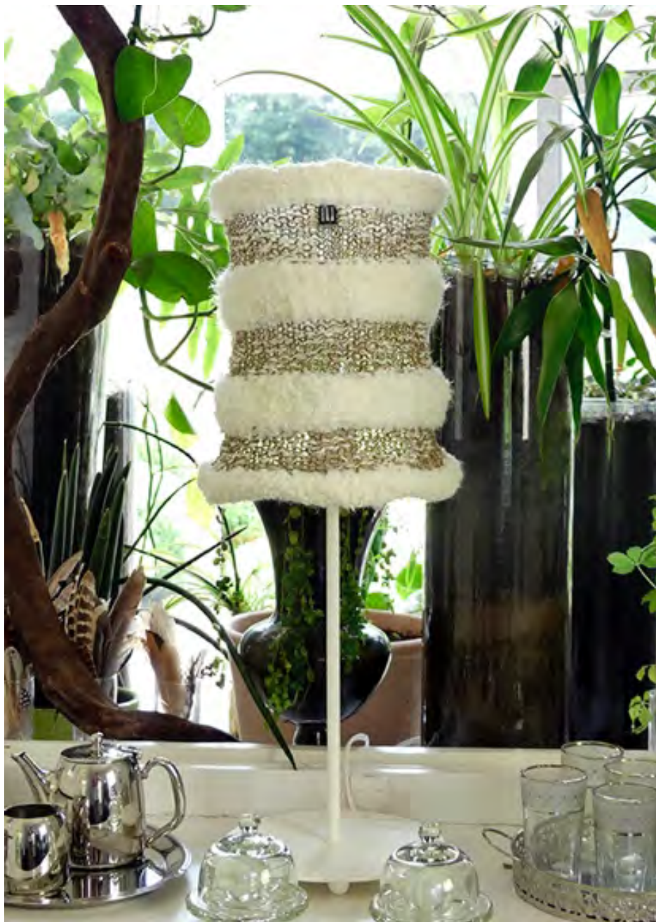
Le travail subtil des mailles de l'abat-jour SARA de la Collection Paris jouent avec les raies de lumière qui le caressent ou qu'il projette dès le soir venu.

Le résultat : les abat-jours luciolle sont vivants et chaleureux, toujours changeants et agréables au toucher. Lorsqu'on tourne autour d'un abat-jour luciolle, sa forme varie à l'infini dans un jeu de petits drapés sans cesse renouvelé.