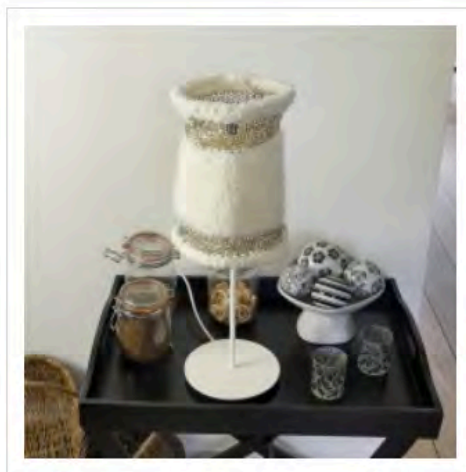
Oslo - Lampe sur pied