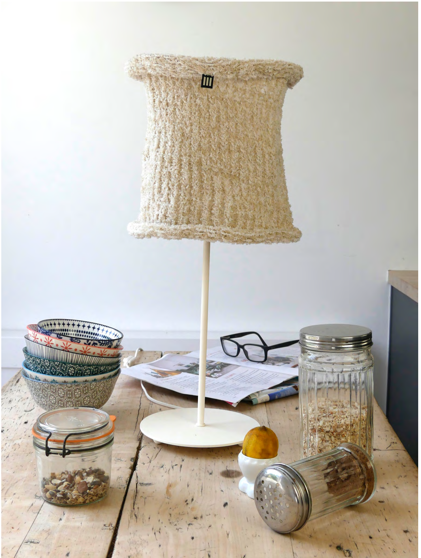
La lampe à poser de la Collection Brest en mailles simples, couleur beurre issu d'un subtil mélange de ficelle de lin peluché clair et blanc écru.