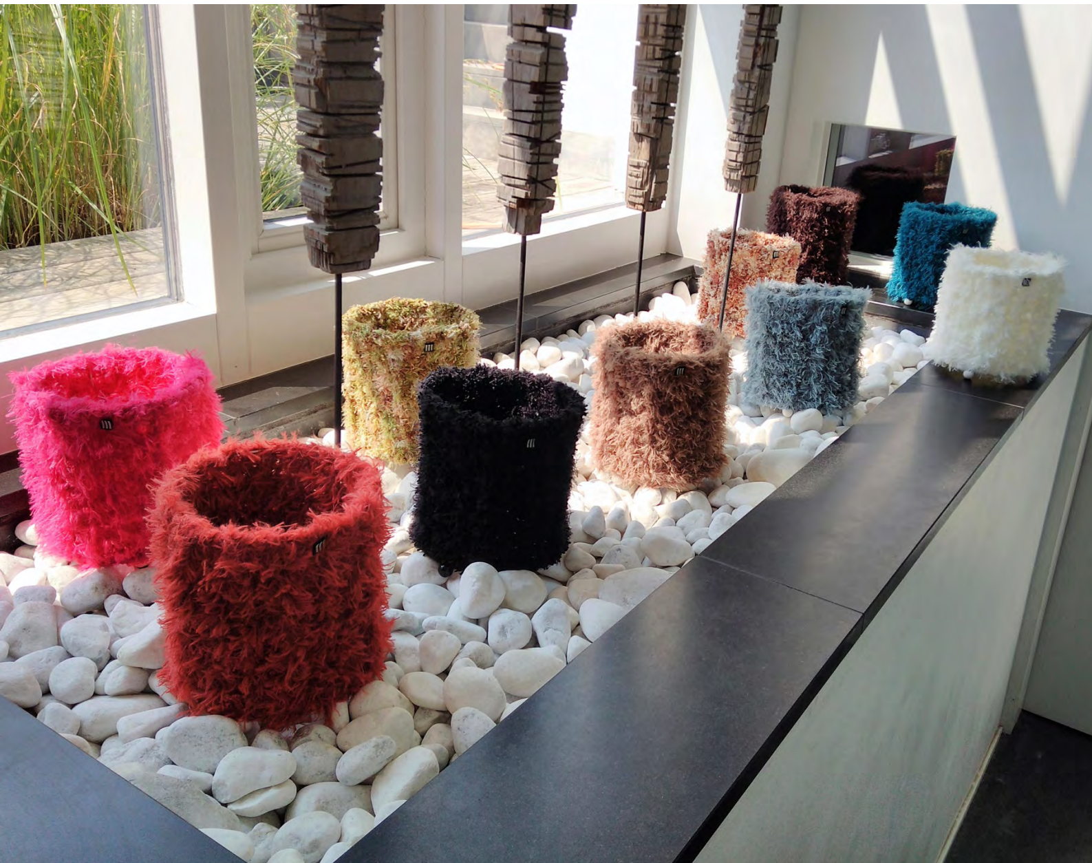
La Collection des "Little", des abat-jours audacieux en mailles, sur pieds-carcasses de 22 cm.

Les ateliers luciolle ont créé des supports d'appliques lumineuses en métal qui peuvent être orientées vers le bas comme vers le plafond, grâce aux variations « UP/TAB » et « DOWN/AIR » de ses abat-jours.