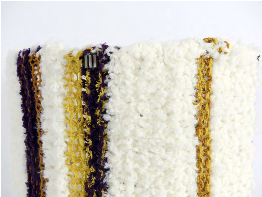
Avec les Mailles de lux, l'atelier luciolle produit des luminaires uniques et personnalisés.

Avec le service Maille de lux, le travail sur la maille rejoint le travail sur la lux (lumière).